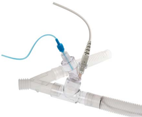
Aerogen Solo am Y-Anschlussstück

Sowohl für beatmete als auch spontan atmende Patienten geeignet